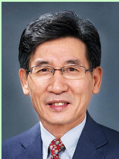
薛其坤 Xue Qikun 清华大学 由国家知识产权局提名

薛其坤，男，1963年12月生，山东蒙阴人。1984年毕业于山东大学，1994年在中国科学院物理研究所获博士学位。现为清华大学教授、南方科技大学校长。2005年当选中国科学院院士。