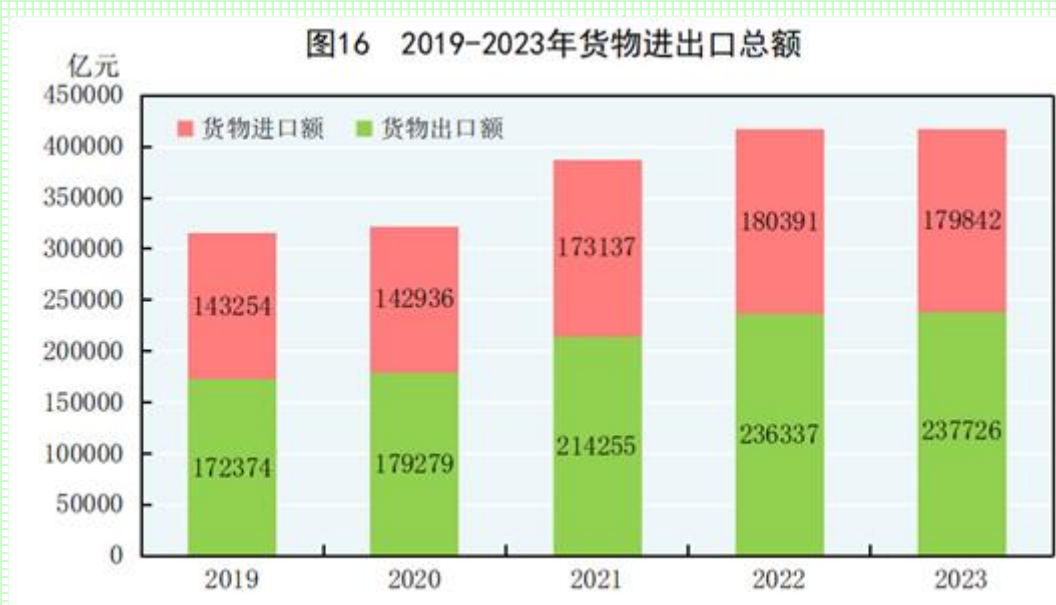
表 10 2023 年货物进出口总额及其增长速度

全年货物进出口总额 417568 亿元，比上年增长 0.2%。其中，出口 237726 亿元，增长 0.6%；进口 179842 亿元，下降 0.3%。货物进出口顺差 57883 亿元，比上年增加 1938 亿元。对共建“一带一路” [46] 国家进出口额 194719 亿元，比上年增长 2.8%。其中，出口 107314 亿元，增长 6.9%；进口 87405 亿元，下降 1.9%。对《区域全面经济伙伴关系协定》（RCEP）其他成员国 [47] 进出口额 125967 亿元，比上年下降 1.6%。民营企业进出口额 223601 亿元，比上年增长 6.3%，占进出口总额比重为 53.5%。