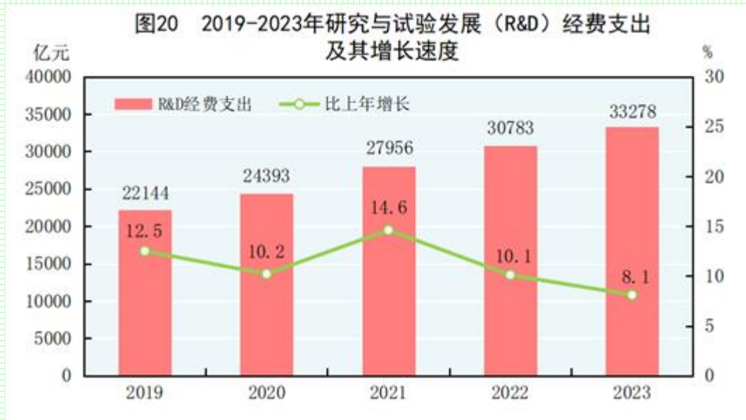
表 17 2023 年专利授权和有效专利情况

全年研究与试验发展（R&D）经费支出 33278 亿元，比上年增长 8.1%，与国内生产总值之比为 2.64%，其中基础研究经费 2212 亿元，比上年增长 9.3%，占 R&D 经费支出比重为 6.65%。国家自然科学基金共资助 5.25 万个项目。截至年末，纳入新序列管理的国家工程研究中心 207 个，国家企业技术中心 1798 家。国家科技成果转化引导基金累计设立 36 只子基金，资金总规模 624 亿元。国家级科技企业孵化器 [64] 1606 家，国家备案众创空间 [65] 2376 家。全年授予发明专利权 92.1 万件，比上年增长 15.3%。PCT 专利申请受理量 [66] 7.4 万件。截至年末，有效发明专利 499.1 万件，比上年末增长 18.5%。每万人口高价值发明专利拥有量 [67] 11.8 件。全年商标注册 438.3 万件，比上年下降 29.0%。全年共签订技术合同 95 万项，技术合同成交金额 61476 亿元，比上年增长 28.6%。我国公民具备科学素质 [68] 的比例达到 14.14%。